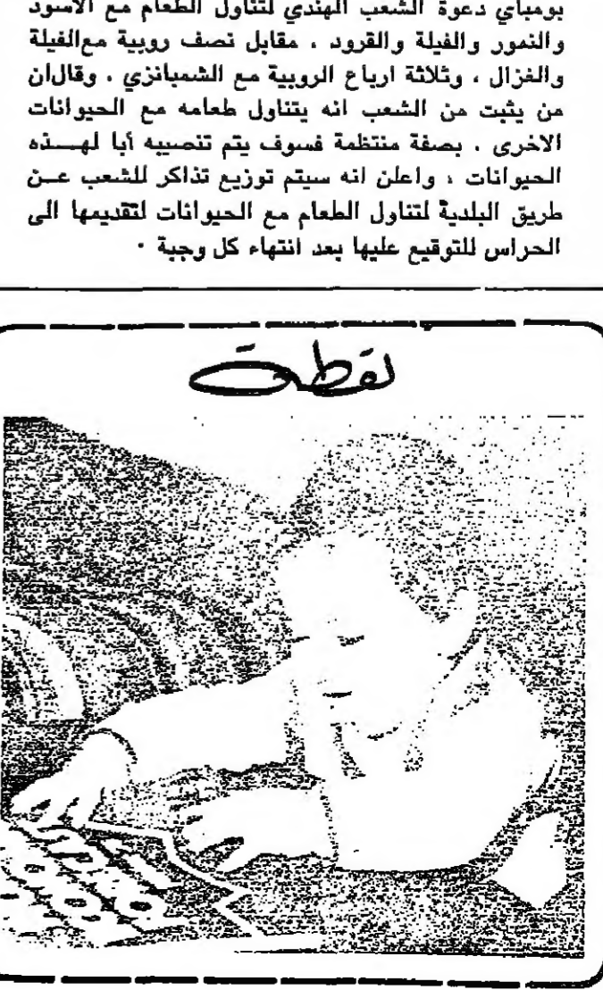
مشهد من المسرحية